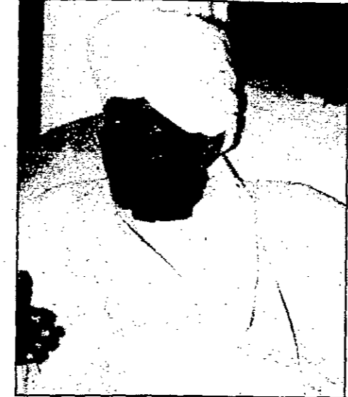
غازي صلاح الدين